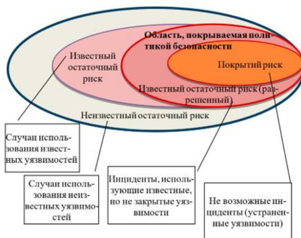
Рис. 2. Соотношение остаточных рисков

Управление рисками безопасности в энергетической системе должно быть непрерывным процессом, охватывающим весь энергетический объект, и осуществляться всеми сотрудниками на всех уровнях организации, а также должно быть нацелено на выявление потенциально опасных событий, влияющих на безопасность. Управление рисками безопасности не является линейным процессом, в котором один компонент оказывает влияние на следующий. Управление рисками безопасности является много-направленным циклически процессом, в котором практически все компоненты могут воздействовать и воздействуют друг на друга. Существует прямая взаимосвязь между целями организации и компонентами процесса управления рисками, представляющими собой действия, необходимые для их достижения. Данная взаимосвязь представлена на трехмерной матрице (см. рис. 3).