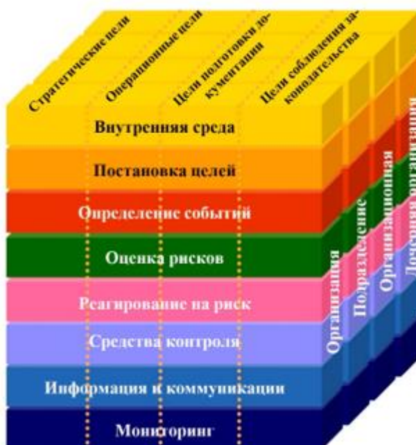
Рис. 3. Взаимосвязь между целями и компонентами процесса управления рисками