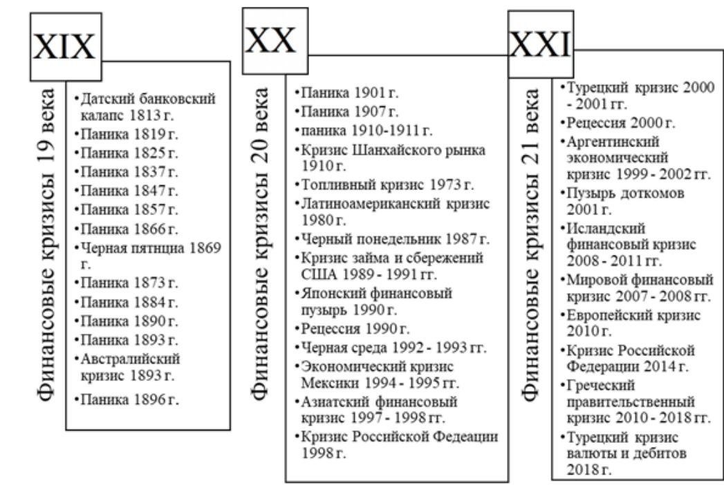
Рис. 1. История мировых финансовых кризисов