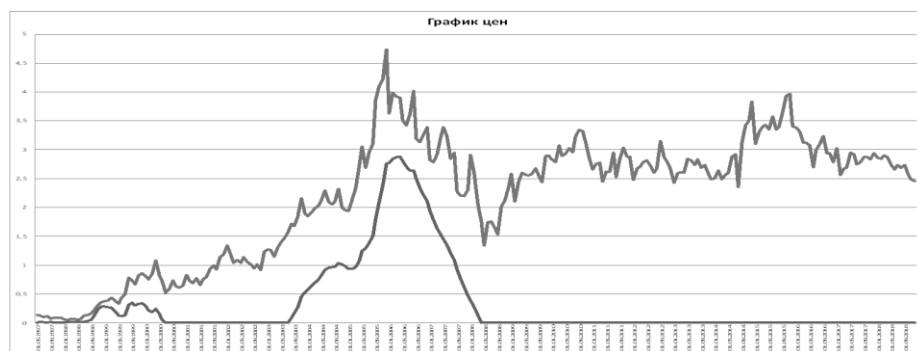
Рис. 3. Модель индикатора на примере ОАО «Сургутнефтегаз»